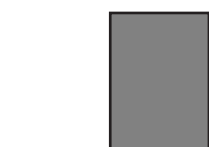
1/1 sivu 210 x 280 mm tai kehys 185x237