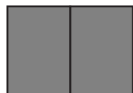
2/1 aukeama 420 x 280 mm