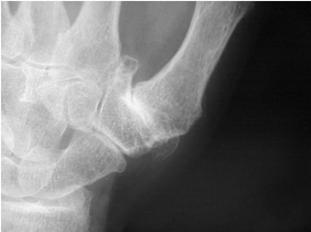
Kuva 4. Peukalon tyvinivelen vaikea ja STT-nivelen keskivaikea artroosi.

Veneluun ja puolikuuluun välisen nivelen (skafolunaari- eli SL-välin) instabiliteetti on yleisin ranteen instabiliteetin muoto. Yleisin vammamekanismi on kaatuminen kämmenen varaan. Kipu paikantuu dorsaalisesti ranteen keskelle. Kliinisessä tutkimuksessa ranne on usein palpaatioaarka dorsaalisesti keskeltä ja Watsonin provokaatiotesti, jossa veneluuta painetaan volaarisesti ja rannetta liikutellaan sivusuuntiin, ei aina paljasta vauriota. Röntgenku-