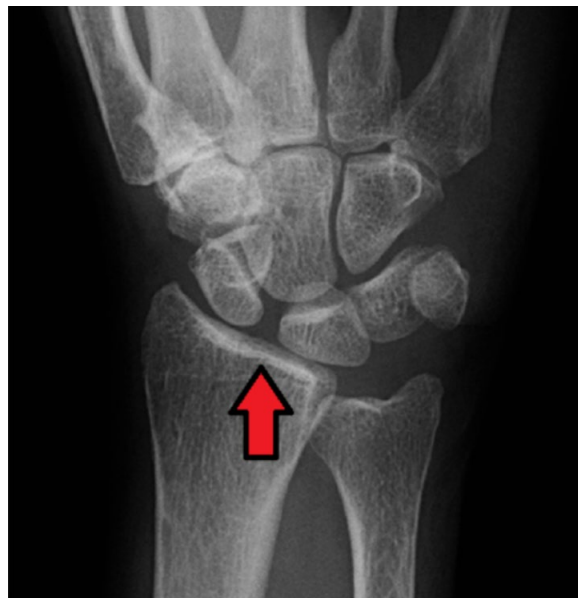
Kuva 5. Veneluun ja puolikuuluun välinen nivel on levinnyt ranteen PA-kuvassa SL-ligamentin repeämän takia.

Ranteen kroonisista kiputiloista merkittävä osa on jänneiden ja niiden kiinnityskohtien rasituksesta johtuvia tai ranteen vääntymisvammaan jälkeiseen nivelsidevamman tai kolmiorustokompleksin vaurioon liittyviä. Valtaosa rasitusvauvoista paranee konservatiivisella hoidolla. Vamman jälkeiset tapaukset on syytä ohjata käsikirurgille parin kuukauden konservatiivisen hoidon jälkeen, jos oireet eivät sinä aikana helpota. Akuutin rannevamman yhteydessä todettu merkittävä DRUJ:n löysyys tai epäily SL-ligamenttivauriosta ovat syy ohjata potilas käsikirurgin konsultaatioon jo primäärivaiheessa.