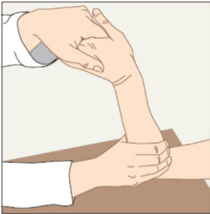
Kuva 1. TFCC:n kuormitustesti. Testin aikana tutkija tukee ulnaa ja vie ranteen ulnaarideviaatioon tehden samalla ranteen fleksio-ekstensioliikettä. Testi tehdään myös pronaatiossa ja supinaatiossa. Kipu on merkittävä löydös.

tiota. Neulan liikkuessa se on jänteessä, eli liian syvällä. Mikäli vaiva ei helpota muutamassa kuukaudessa riittävästi, vapautetaan jänteet leikkauksella. De Quervainin jännetupittulehdus hoidetaan perusterveydenhuollossa. Käsikirurgia konsultoidaan, jos kortisonipistos ei paranna vaivaa.